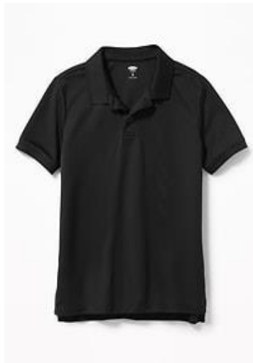
Solid Black Polo