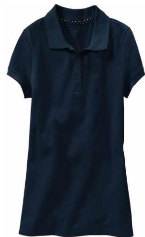
Solid Navy Polo