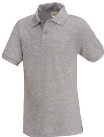
Solid Grey Polo